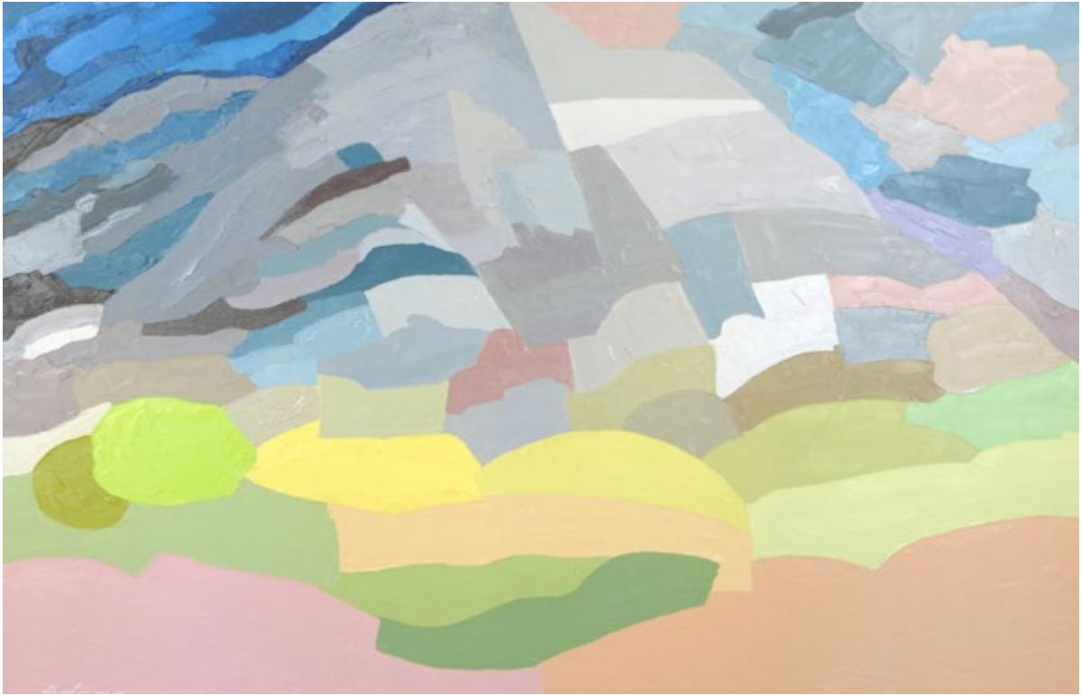
Etel Adnan Mount Tamalpais [Mont Tamalpais], 1985 Huile sur toile. 148 x 125 cm Don de l'artiste, 2007 Collection musée Sursock