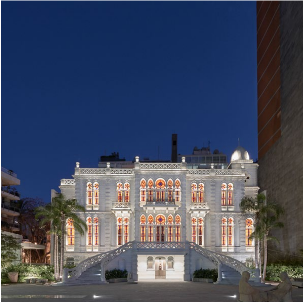
Le musée Sursock de nuit