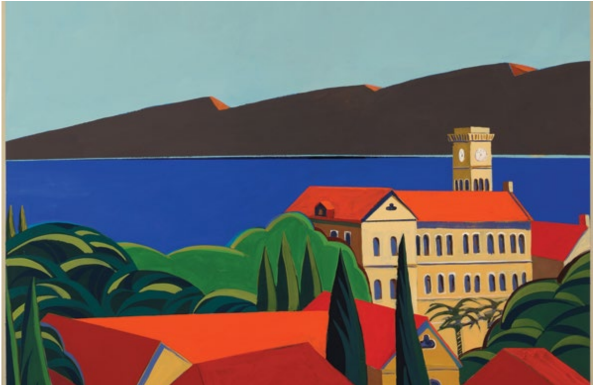
Hussein Madi. Untitled [Sans titre], 1999 Acrylique sur toile. 100 x 100 cm Collection Leila et Touma Arida