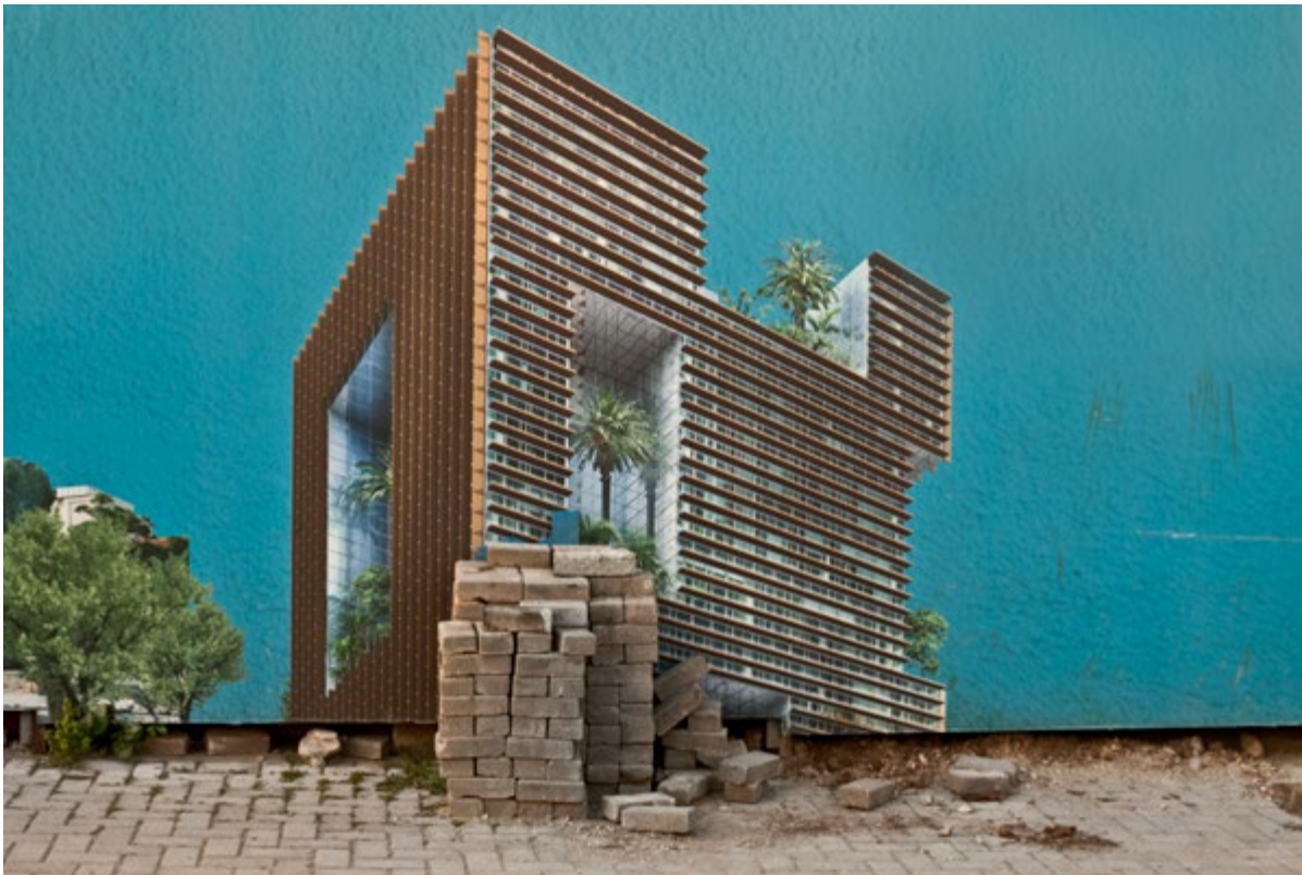
Randa Mirzab. The Selective Residence [La Résidence sélective], 2013 Encre pigmentée sur canson baryte. 80 x 110 cm