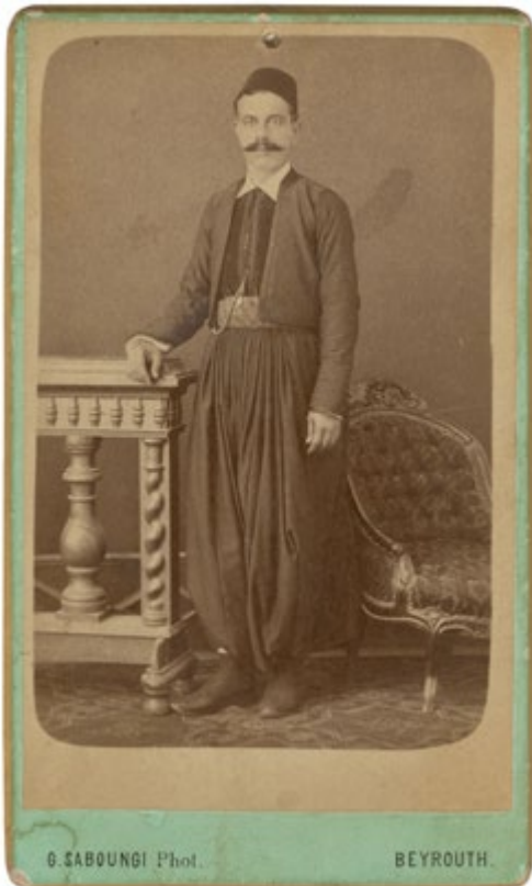
Georges Saboungi Untitled [Sans titre], 1890s Tirage albumine monté sur carton, 16.3 x 10.8 cm