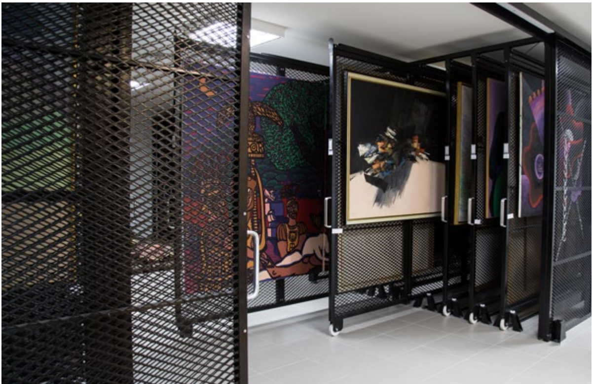
Les réserves aux conditions spécifiques de contrôle climatique