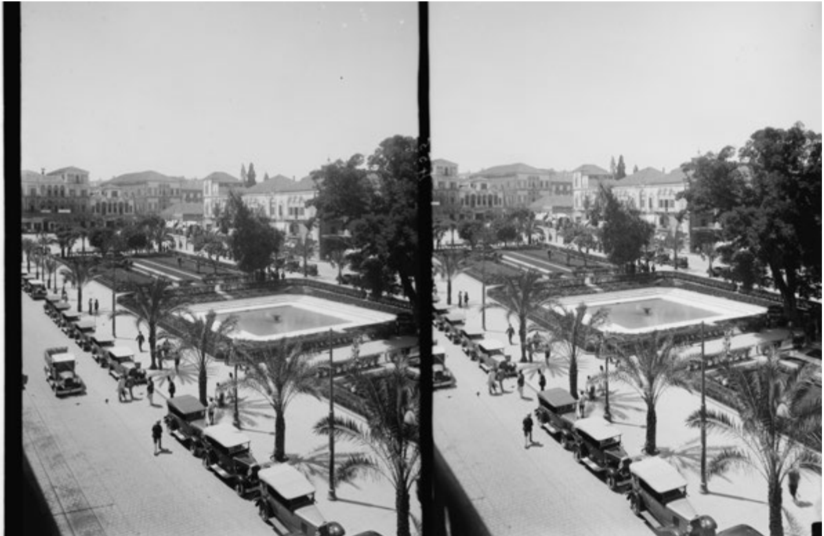
Beyrouth. Le jardin public. Circa 1900-1920 Colonie américaine (Jérusalem).